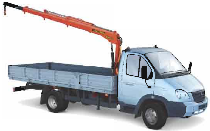
КМУ-31 на в/м ГАЗ-33104 «Валдай»

Монтажными базами для КМУ-31 являются: ГАЗ 33104 «Валдай», ЗИЛ 5301 «Бычок», КАМАЗ 4308, МАЗ 437041 «Зубрёнок», ISUZU NQR75, Hyundai HD 78 и другие среднетоннажные автомобили г/п до 6 тонн.