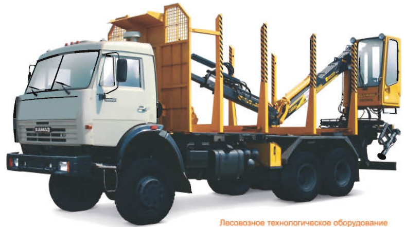
Лесовозное технологическое оборудование ТОК-70.1 с ОМТЛ-97-04К great